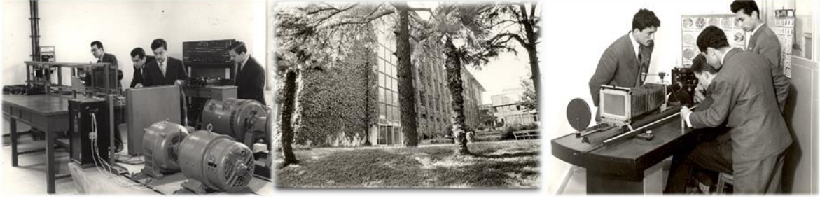
Geçmiş Yıllara Ait YTÜ Fotoğraf Arşivinden Yerleşke Ve Atölye Görünümleri