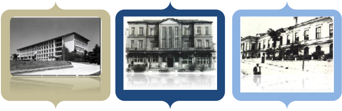
Gemiřte YT Yerleřkeleri

İstanbul Devlet Mhendislik ve Mimarlık Akademisi, 03 Haziran 1969 tarihinde yayımlanan 1184 sayılı Devlet Mhendislik ve Mimarlık Akademileri Yasasıyla, zerkliđi olan yksek dereceli bir đretim ve arařtırma kurumu olarak kurulmuřtur. 1971’de zel yksekokullar 1472 sayılı yasa ile kapatılmıř, bunlardan mhendislikle ilgili olanları İstanbul Devlet Mhendislik ve Mimarlık Akademisi’ne bađlanmıřtır.