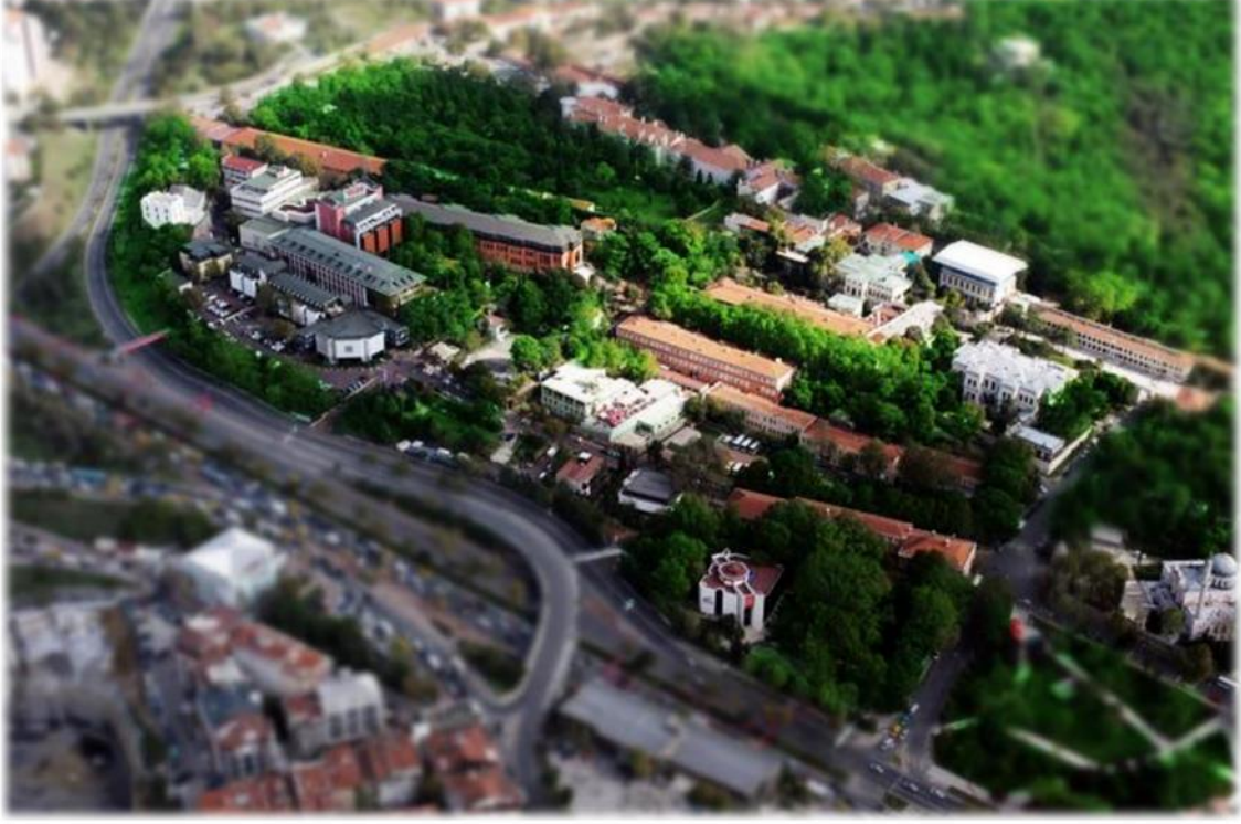
Yıldız Yerleşkesi Görünümü

Üniversitemiz Davutpaşa ve Yıldız (Beşiktaş) olmak üzere 2 yerleşkeye sahiptir.