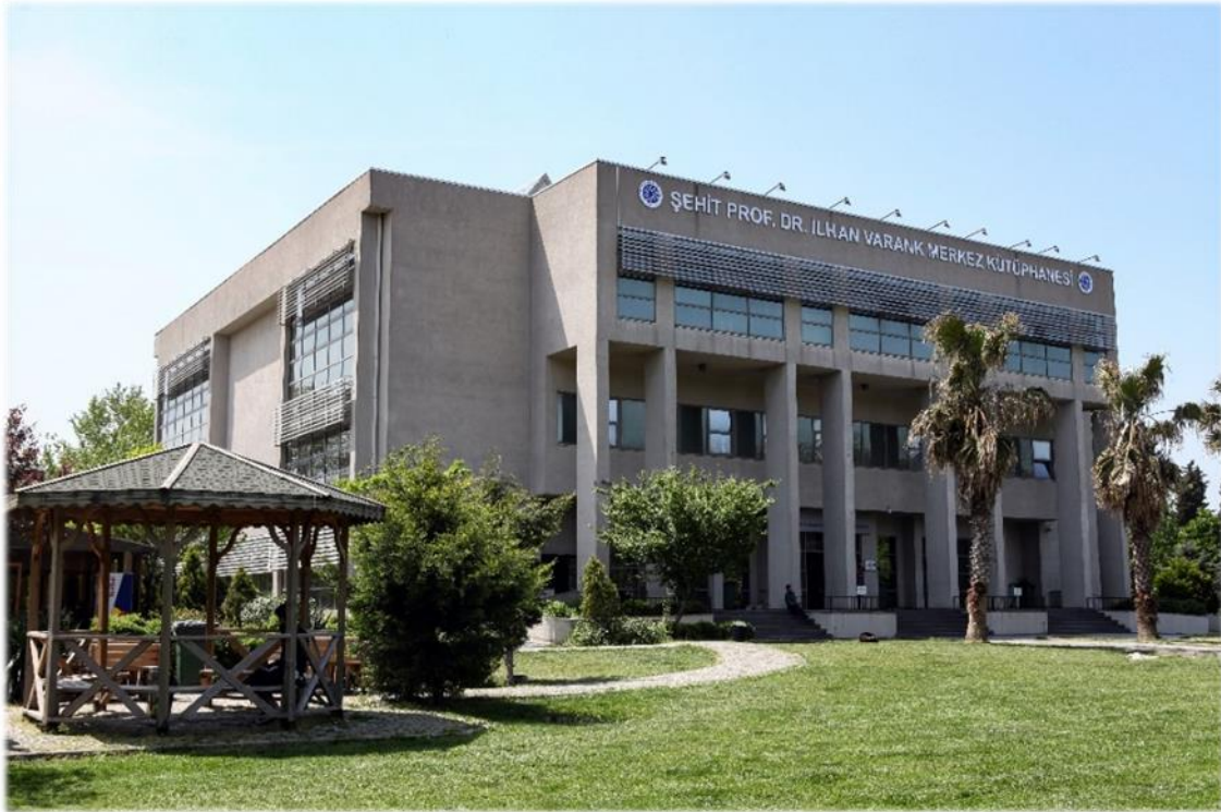
Şehit Prof. Dr. İlhan VARANK Merkez Kütüphanesi / Davutpaşa Yerleşkesi